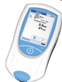
CoaguChek XS Plus

COAGUCHEK, SOFTCLIX and BECAUSE IT'S MY LIFE are trademarks of Roche.